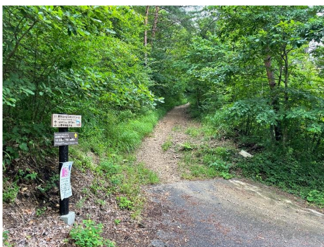
特区間スタート地点